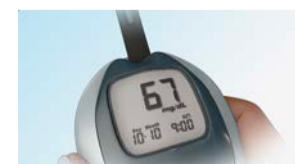
혈당이 너무 낮습니다.