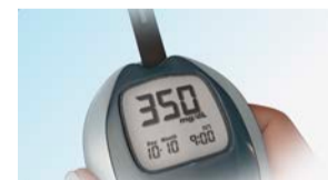
혈당이 너무 높습니다.